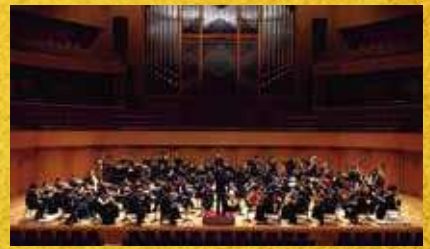
名古屋フィルハーモニー交響楽団