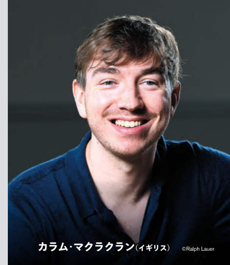
カラム・マクラ克蘭(イギリス)