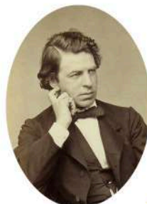
Joseph Joachim 1831-1907