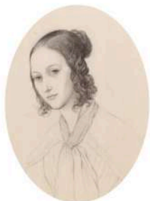
Clara (Wick) Schumann 1819-1896