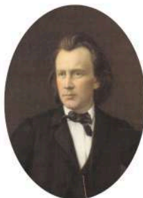
Johannes Brahms 1833-1897