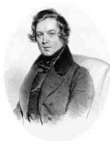
Robert Schumann 1810-1856