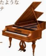
J.B.シュトライヒャー (ウィーン 1845年)

第8回公演は、鍵盤音楽史上燦然と輝く名曲、ベートーヴェン後期のピアノソナタをお届けします。フォルテピアノは、2020年にリリースしたCD「ハンマークラヴィア」と同じ、ベートーヴェンとプライヴェートでも深く関わりのあったJ.B.シュトライヒャー。フォルテピアノの響きが美しいヤマハホールで、晩年のベートーヴェンの解脱したような宇宙的とも言える孤高のフォルテピアノの世界に挑みます。