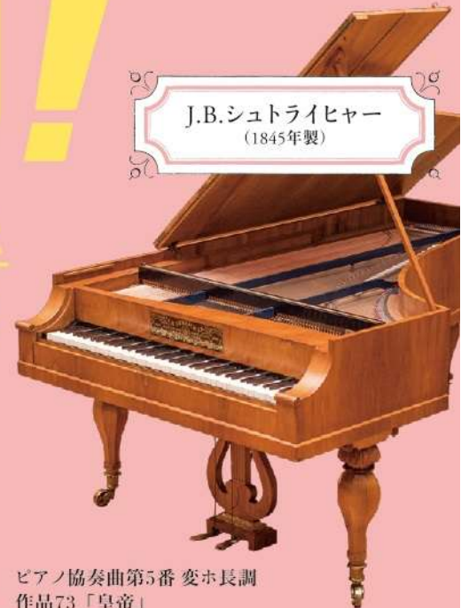
J.B.シュトライヒャー (1845年製)

ピアノソナタへ短調 作品57「熱情」 第1楽章 チェロソナタ第3番 4長調 作品69 第3楽章