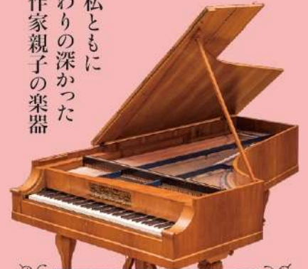
J.B.シュトライヒャー 1845年製

プライベートでも親しかったピアノ製作家シュトライヒャー夫妻の息子であるヨハン・バプティストが1845年に製作した楽器。ウィーン式アクションの軽やかなタッチによる繊細な表情と、歌うような豊かなサウンドが魅力。6オクターヴ半の音域をもっており、これは晩年のベートーヴェンが望んだ音域でもある。1824年にベートーヴェンはバプティストのピアノを試弾している。