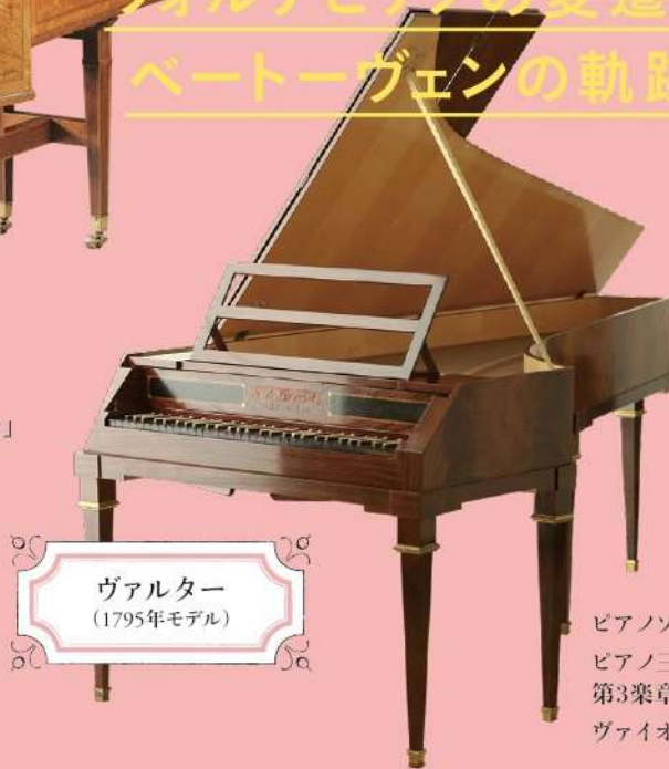
ヴァルター (1795年モデル)

ピアノ協奏曲第5番 変ホ長調 作品73「皇帝」 エリーゼのために WoO59-3