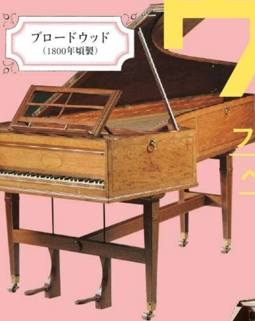
ブロードウッド (1800年頃製)

ピアノソナタへ短調 作品57「熱情」 第1楽章 チェロソナタ第3番 4長調 作品69 第3楽章