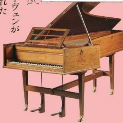
J.ブロードウッド&サン 1800年ごろ (太田垣至修復2020年)