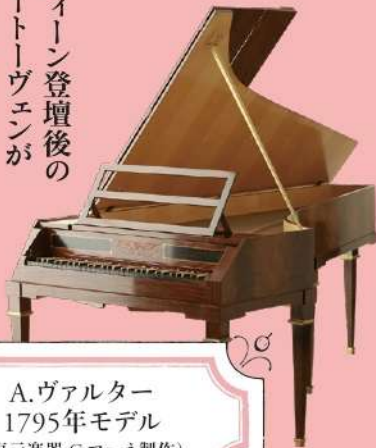
A.ヴァルター 1795年モデル (復元楽器 C.マーネ製作)

ウィーン式アクションと呼ばれるシンプルなアクションをもち、ダンパー ※1 を解放させる装置と、弦とハンマーの間に薄い布を挟み込み音色を変化させるモデラート ※2 がついている。足ペダルではなく膝ペダルで操作する。音域は5オクターヴで軽いタッチ、明快な発音、倍音の豊かな音色が魅力。初期のソナタはまさにこのタイプの楽器を想定して書かれた。