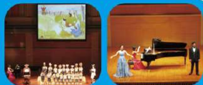
♪ 前回の公演の様子 ♪