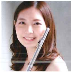
フルート 福島さゆり Sayuri Fukushima

セントラル愛知交響楽団特別客演指揮者。1982年プザンソン国際指揮者コンクールで女性初の優勝。1983年N響を指揮して以来、国内外の多くのオーケストラと共演。2001年カーネギーホールにてベートーヴェンの第九を指揮する。平成28年度愛知県芸術文化選奨受賞。トリフォニーホール・ジュニア・オーケストラの音楽監督を兼任。2015年4月より愛知県立芸術大学客員教授。アンサンブル・フォルテ指揮者。女声合唱団マドンナ「かきつばた」ディレクター。