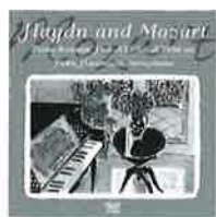
ハイドゥンとモーツァルト

モーツァルト:ピアノ・ソナタニ長調 KV311(284c)/モーツァルト:ピアノ・ソナタハ長調 KV309(284b)/J.C.バッハ:ピアノ・ソナタイ長調Op.17-5/モーツァルト:ピアノ・ソナタイ短調 KV310(300d) ※使用楽器:ベーゼンドルファー モデル280 ALCD-9075 価格:¥2,500+税