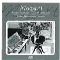
青春のモーツァルト

モーツァルト:ピアノ・ソナタニ長調 KV311(284c)/モーツァルト:ピアノ・ソナタハ長調 KV309(284b)/J.C.バッハ:ピアノ・ソナタイ長調Op.17-5/モーツァルト:ピアノ・ソナタイ短調 KV310(300d) ※使用楽器:ベーゼンドルファー モデル280 ALCD-9075 価格:¥2,500+税