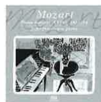
学習するモーツァルト

モーツァルト:ピアノ・ソナタ変ホ長調KV282(189g)/J.C.バッハ:ピアノ・ソナタト長調Op.5-3/モーツァルト:ピアノ・ソナタト長調KV283(189h)/J.C.バッハ:ピアノ・ソナタニ長調Op.5-2/モーツァルト:ピアノ・ソナタニ長調KV284(205b)《デュルニッツ》 ※使用楽器:ベーゼンドルファー・インベリアル ALCD-9109 価格:¥2,500+税