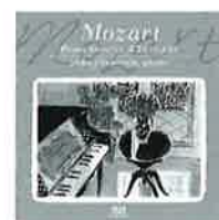
優雅なるモーツァルト

モーツァルト:ピアノ・ソナタ変ホ長調KV282(189g)/J.C.バッハ:ピアノ・ソナタト長調Op.5-3/モーツァルト:ピアノ・ソナタト長調KV283(189h)/J.C.バッハ:ピアノ・ソナタニ長調Op.5-2/モーツァルト:ピアノ・ソナタニ長調KV284(205b)《デュルニッツ》 ※使用楽器:ベーゼンドルファー・インベリアル ALCD-9109 価格:¥2,500+税