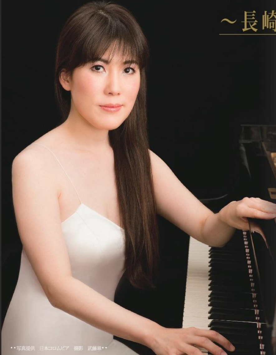
**写真提供 日本コロムビア 撮影 武藤章**