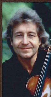
ピエール・アモイヤル (ヴァイオリン)