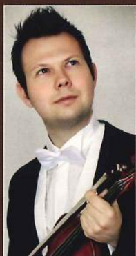
フェリックス・ フロッシュハマー (ヴァイオリン)

モーツァルト: ディヴェルティメント K136 ピアノ協奏曲 第13番 K415 ソリスト: 菅野 潤