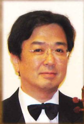
七澤清貴 ヴァイオリン