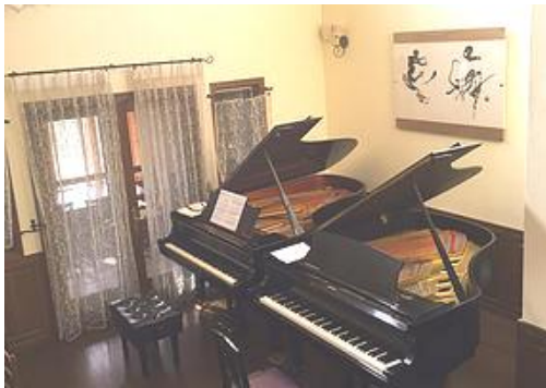
セミナー会場 シェモザー

宿泊（シェモザー）全4泊5日 30,000 円 （前日から宿泊の場合は、+5,000 円）